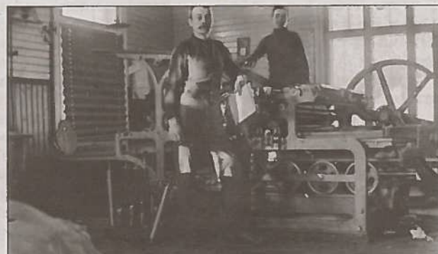
Okända arbetare på Östra Nylands tryckeri anno dazumal.